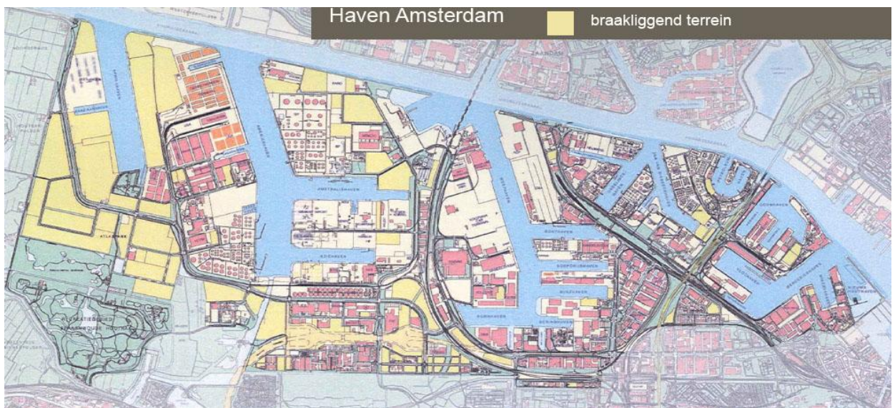
Kaart 1, begrenzing van het gebied waar de ontheffing met kenmerk FF/75C/2007/0441 op van toepassing is.

Voor meer informatie over de ontheffing met kenmerk FF/75C/2007/0441 wordt verwezen naar: Haven Amsterdam, Postbus 19406, 1000 GK Amsterdam, 020 5234528 / 020 5234745