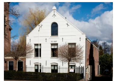
Schuilkerk de Hoop

Wij onderschrijven de waarde en de potentie van De Hoop als concertzaal in en voor Diemen. Samen met het bestuur van de Stichting Vrienden van De Hoop willen wij dan ook bezien op welke wijze deze potentie meer kan worden aangesproken. Daarbij dient in ieder geval aandacht te zijn voor de huurtarieven die voor het gebouw gelden. Deze zijn aan de hoge kant en staan de huur van het gebouw door Diemense gezelschappen mogelijk in de weg. Met de eigenaar van De Hoop, i.c. Stadsherstel Amsterdam, kan hierover worden gesproken en daarnaast kunnen eventueel van gemeentewege te verstrekken incidentele huursubsidies mogelijk huurbevorderend werken.