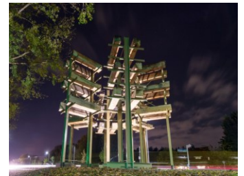
“De Stelling van Diemen”, Observatorium (2016)

Los van de koppeling van beeldende kunst aan infrastructurele projecten staat het collegebesluit van 11 april 2017 om in het kader van de zichtbaarheid van het gemeentelijke LHBT-beleid in Diemen een permanente kunstuiting te realiseren. De in regenboogkleuren aangebrachte letters “Gemeentehuis” op het gemeentehuis worden vooralsnog namelijk gezien als een tijdelijke uiting van zichtbaarheid van dit beleid. Aan dit besluit zal concreet invulling worden gegeven. Voor de kosten van deze kunstuiting kan conform een collegebesluit van 26 mei 2015 tot een bedrag van maximaal € 50.000,- in ieder geval een beroep worden gedaan op de in de gemeentebegroting opgenomen voorziening “Groot onderhoud verhardingen”.