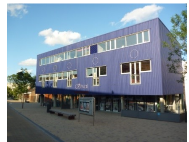
Theater de Omval

Het bestuur van de stichting stelt om de vier jaar een beleidsplan op. Het laatste beleidsplan “De Culturele magneet van Diemen” dateert uit 2014 en loopt tot en met 2017. Een nieuw beleidsplan zit in de pijplijn maar verschijnt te laat om daarover in deze nota nog iets op te merken. De verwachting is echter dat het bestuur het met “De Culturele magneet van Diemen” ingezette beleid zal voortzetten. Dit beleid komt er samengevat op neer dat Theater De Omval met een hoogwaardig aanbod aan theater en film een goed onderdak biedt voor Diemense culturele verenigingen en instituten. Met mooie zalen en een horecagelegenheid die functioneert als de huiskamer van Diemen, wil Theater De Omval nog meer aantrekkingskracht gaan uitoefenen op iedereen die belangstelling heeft voor kunst en cultuur en alle mensen die een aangename plaats van samenkomst zoeken. Wij onderschrijven dit beleid en zullen onze steun aan de stichting de komende jaren onverkort continueren.